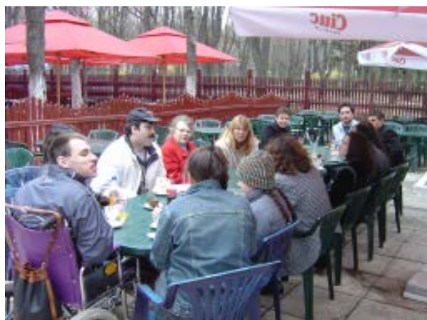
Groupe d'étudiants handicapés. Il faisait froid, mais nous étions si heureux d'être ensemble que c'est la chaleur qui nous habitait.

Nous allons deux fois par année sur place pour passer du temps avec nos filleuls. Nous voulons les aider à subvenir à leurs besoins et surtout leur permettre de lever les yeux comme tout être humain en a le droit, leur donner la possibilité de (sur)vivre convenablement. Eux, pour leur part, nous le rendent par leurs sourires, leur réception dans leurs humbles demeures ou leurs fleurs, par un email ou une carte postale. Mais surtout notre plus grand bonheur est surtout quand ils réussissent à s'en sortir seuls. Plusieurs d'entre eux y arrivent, grâce à leur courage et à la confiance en eux qu'ils retrouvent petit à petit.