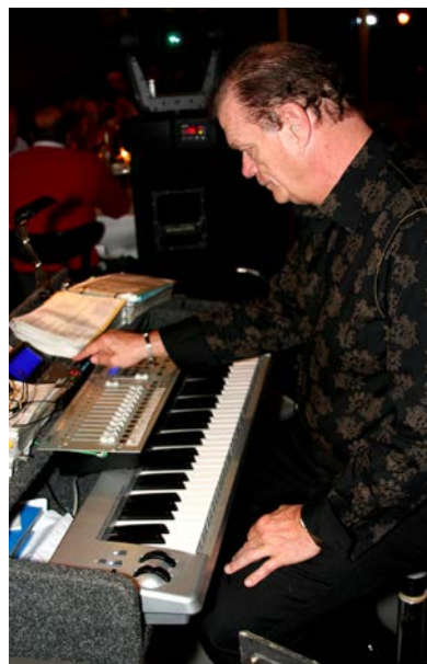
Folio au piano