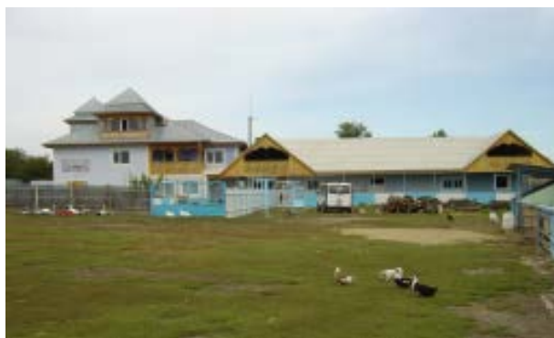
Les ateliers de la Maison de Grégory & Didier