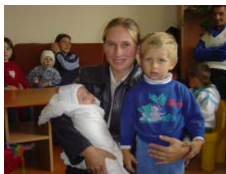
Filles-mères au Centre Maternel