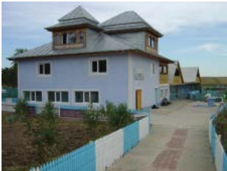
La Maison de Grégory & Didier

La Maison a subi des problèmes d'infiltration d'eau, de chauffage et d'isolation. Beaucoup de ce travail a été exécuté cette année. L'année prochaine, il faudra les terminer.