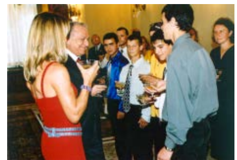
Nos jeunes avec le Président Illiescu lors de la remise de la Médaille du Mérite octroyée à l'association en 2002