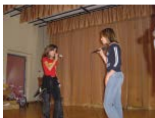
2 jeunes chanteuses nous charment de leurs belles voix