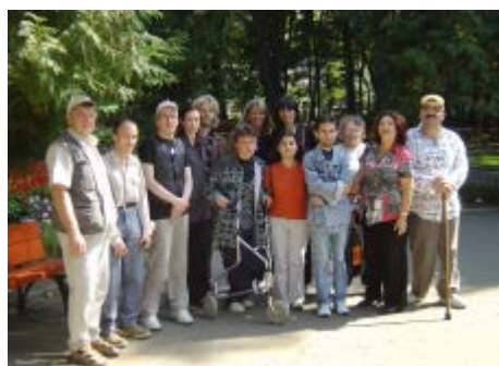
Un groupe d'étudiants handicapés