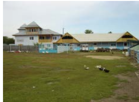
La Maison et les ateliers