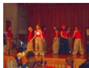
Un groupe de danseurs captive la salle par sa superbe chorégraphie