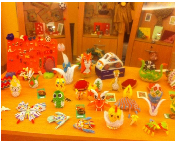
Vente d'origami, fabriqués par nos étudiants handicapés (d)