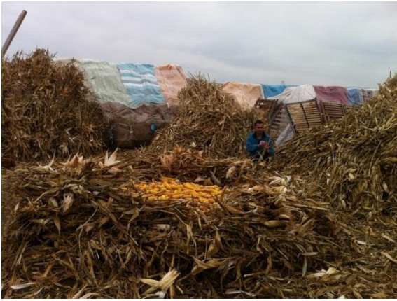
A la Maison de Grégory & Didier à Popesti, préparation des réserves pour nourrir les animaux durant l'hiver

Toute l'équipe des compagnons d'Emmaüs cultive et récolte, élève des poules, des cochons, des lapins, des chèvres, des moutons pour subvenir à leurs besoins de nourriture. Une vache leur donne du lait, un cheval leur permet de transporter le bois et les récoltes sur le char auquel il est attelé.